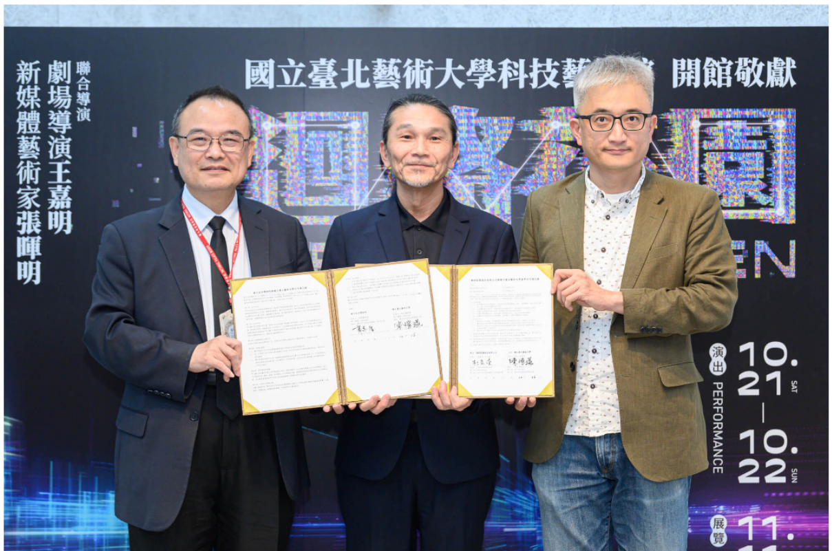
北藝大攜手元宇宙藝術大學夥伴，共創科技藝術的嶄新整合與應用。