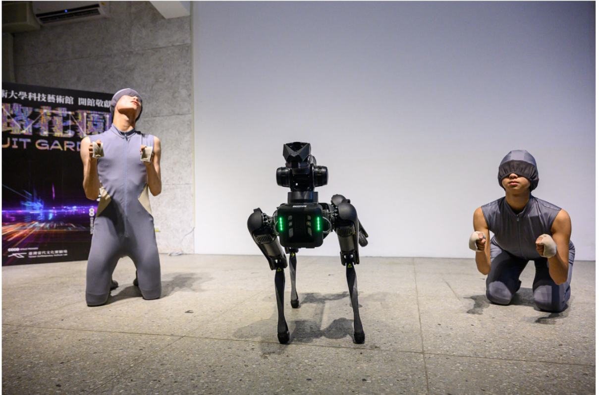
《迴路花園》與機器狗舞蹈片段呈現，透過複雜AI軟體編碼，依照演出劇情設定，機器狗將成為「引路人」的角色。

今日記者會邀請到《迴路花園》演出的特別來賓——機器狗和舞者共舞，呈現演出精華片段。機器狗可愛模樣，一出場即成為閃光燈焦點。機器狗由台北科技大學與美國麻省理工學院共同成立的「台北科技大學城市科學實驗室」所研發，在行走時能夠偵測與閃躲障礙物，攀爬斜坡樓梯，本次受邀參與《迴路花園》的演出，透過複雜AI軟體編碼，依照演出劇情設定，機器狗將成為「引路人」的角色。